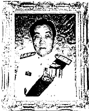
นายชวรัตน์ ชาญวีรกูล รัฐมนตรีว่าการกระทรวงมหาดไทย