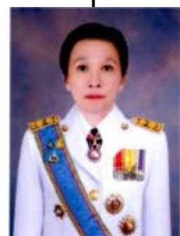
นางสาวธनिया นัยพิณิจ รองผู้ว่าราชการจังหวัดขอนแก่น คนที่ 4