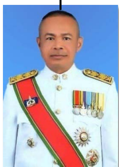
นายจาริก เหล่าประเสริฐ รองผู้ว่าราชการจังหวัดขอนแก่น คนที่ 1