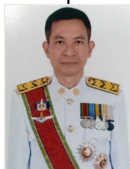
นายพันธ์เทพ เสาศิโกล รองผู้ว่าราชการจังหวัดขอนแก่น คนที่ 3